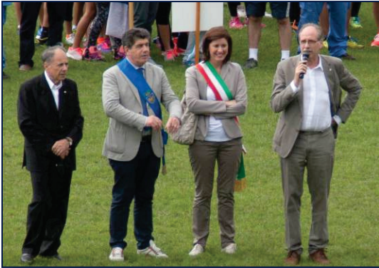
La Presidente Debora SERRACCHIANI durante la cerimonia di apertura del 25° TcM